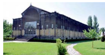
Campus de la Universidad de Extremadura. Badajoz.

Dentro del conjunto de acciones que se vienen desarrollando en la Universidad española para mejorar la calidad, se encuentra la evaluación de la actividad investigadora de su profesorado, tanto funcionario como contratado laboral.